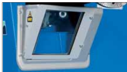
Automatisk datainläsning med laser.

Den digitala däckbalanseringsmaskinen geodyna 6900p, med automatnav för fastspänning av däck, scanner för automatisk inläsning av däckets data och en platt dataskärm, möter de höga krav som professionella verkstäder idag ställer.